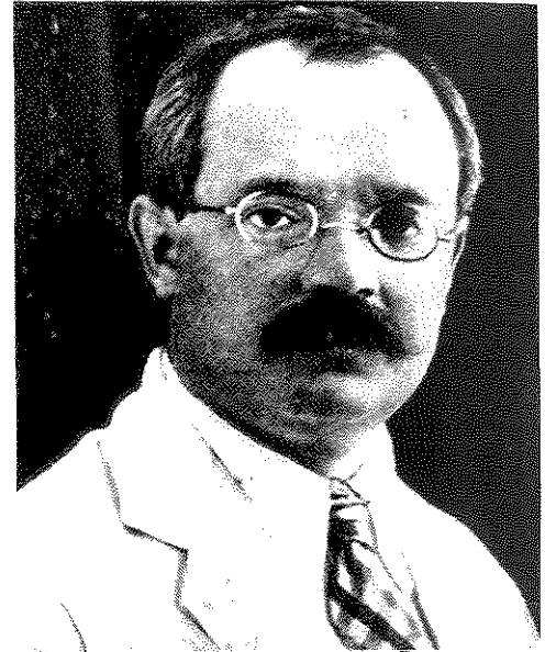
עורך משה גליקסון. גליקסון ערך את "הארץ" בשנים 1937-1922