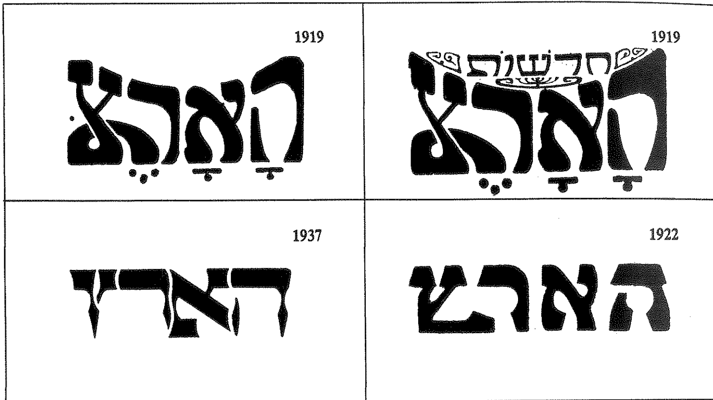
גלגוליו של לוגו. מ-1937 מופיע "הארץ" עם אותו לוגו

הרוח ובאותו החופש כמו עד היום. 16 שוקן נבחר. הרומן היה קצר וחסר משמעות. הוא לא הרים תרומה לעבודת הכנסת ומהר מאוד גילה שאין במפגש בבית פרומין בירושלים (משכן הכנסת) רמה המזכירה אפילו את רמת האדרגלין שבעשיית העתון ברחוב מזא"ה בתל-אביב. הכנסת, חש, גוזלת את זמנו. 17 מהר מאוד חזר ושקע בעבודת העתון. המפלגה הפרוגרסיבית לא הצרה את צעדיו. לפני ארבעים שנה סיכם שוקן את ארבעים שנות העתון. "הארץ" רואה את עצמו כעתון בלתי תלוי בשביל הקורא החושב מחשבה עצמאית, " כתב שוקן והוסיף הסבר מסורבל: "אנשי מפלגה מתיחסים לפעמים בלגלוג לכנוי 'בלתי תלוי'. גם עתון יומי 'בלתי תלוי' במשהו, אומרים הם. הוא תלוי מצד אחד בבעליו ומצד שני בקהל קוראיו, שבלי תמיכתו לא יוכל להתקיים. דברים אלה נכונים הם. אף על פי כן אין המושג 'עתון בלתי תלוי' נטול תוכן. עתון בלתי תלוי אינו תלוי במפלגה פוליטית, כלומר בעליו וכותביו אינם משתתפים בתחרות על השלטון במדינה, ואין הנהלת מפלגה, אשר על אף היותה גוף זר למערכת העתון ונפרד ממנו, קובעת את הקו שלו. אמנם גם עתון בלתי תלוי יכול להיות בבעלותו של אדם פרטי שאינו משתתף בפועל בעריכתו ושאוּלֵי יש לו אינטרסים כלכליים מכריעים מחוץ לתחום העתון. אי-תלותו של עתון כזה מוגבלת. אך לא כך המצב במקרה של עתון שבעליו הוא גם עורכו ויחד עם חברי המערכת הבכירים הוא המעצב את דמותו. זה